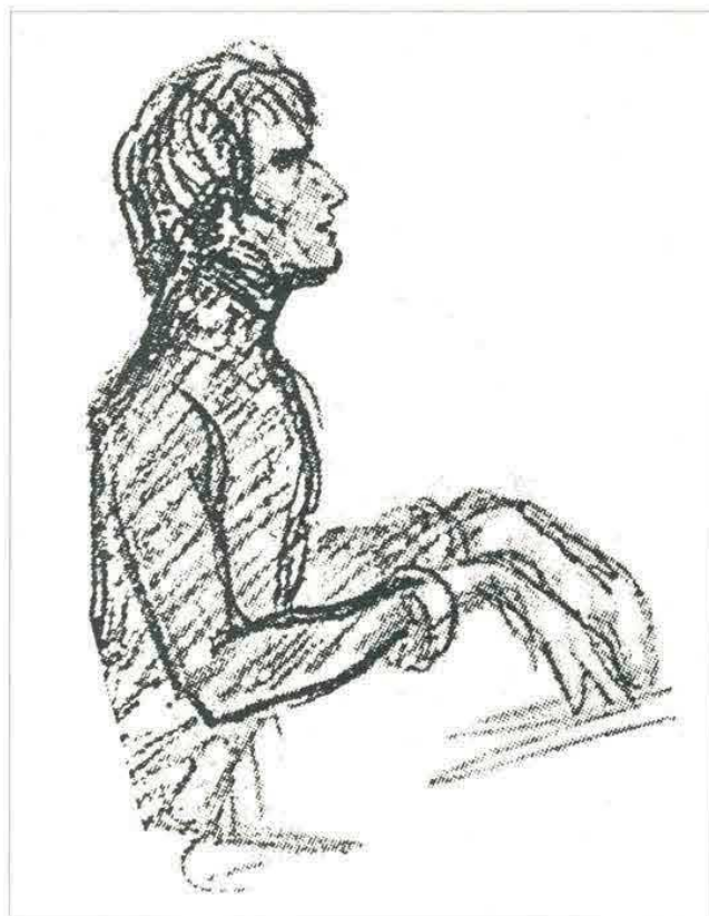
Fig. 77: Franz Liszt nel 1936 (disegno di Scheffer, Ginevra, Conservatorio)

Eccone il testo integrale, tradotto dall'originale francese: