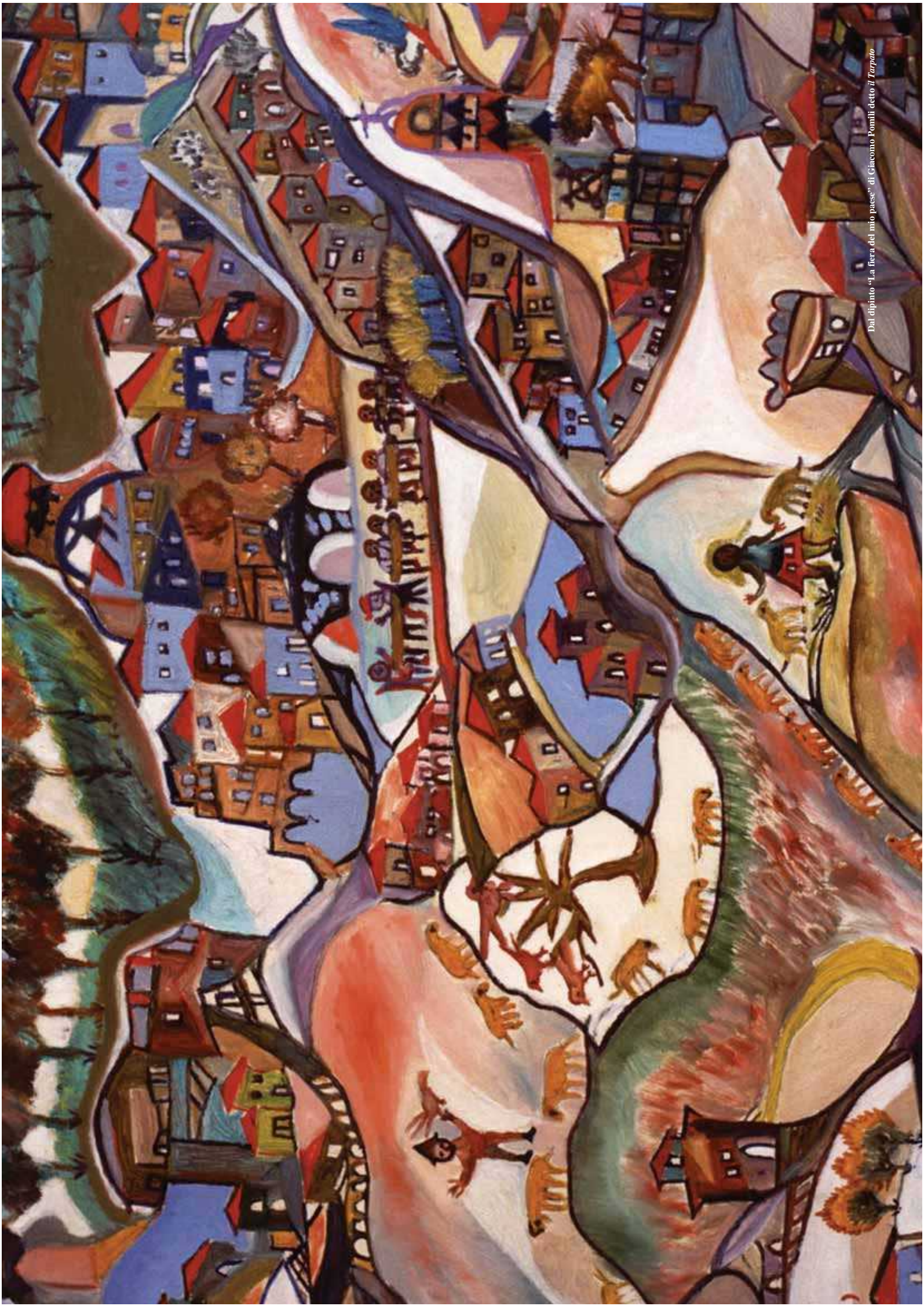
Dal dipinto "La fiera del mio paese" di Giacomo Pomili detto il Tarpaio